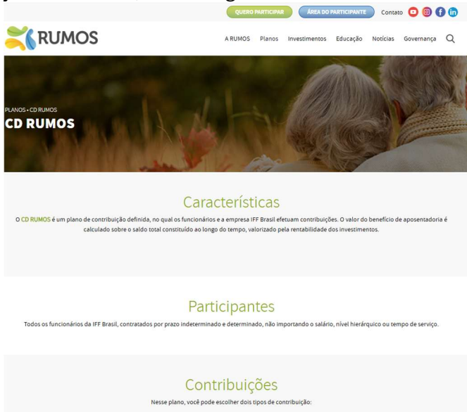
Página na Internet Plano CD RUMOS

Execução em 2025: publicada no sítio da RUMOS na internet e disponível por todo o período. Em junho de 2025, foram registrados 213 acessos.